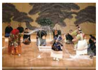
藝大プロジェクト2022「藝大百鬼夜行」より

仮面が持つこの奥深い魅力をご堪能いただくべく、10/21(土)の第1回はアジアの仮面舞踊を中心に、11/25(土)の第2回では16~18世紀ヨーロッパで隆盛を迎えたコメディ・デラルテ(仮面即興劇)をお送りする予定です。どうぞお楽しみに!