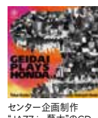
センター企画制作 「JAZZ in 藝大」のCD

「障がいとアーツ研究」「劇場技術論Ⅰ・Ⅱ」「舞台芸術実践論Ⅰ・Ⅱ」「ビデオプロダクション入門」「サウンドレコーディング基礎演習」「ホール音響概論(集中講義)」「社会哲学特講Ⅰ・Ⅱ」「舞台芸術広報概論」「音楽アーカイブ実践論」 ※年度により開講しない授業科目あり